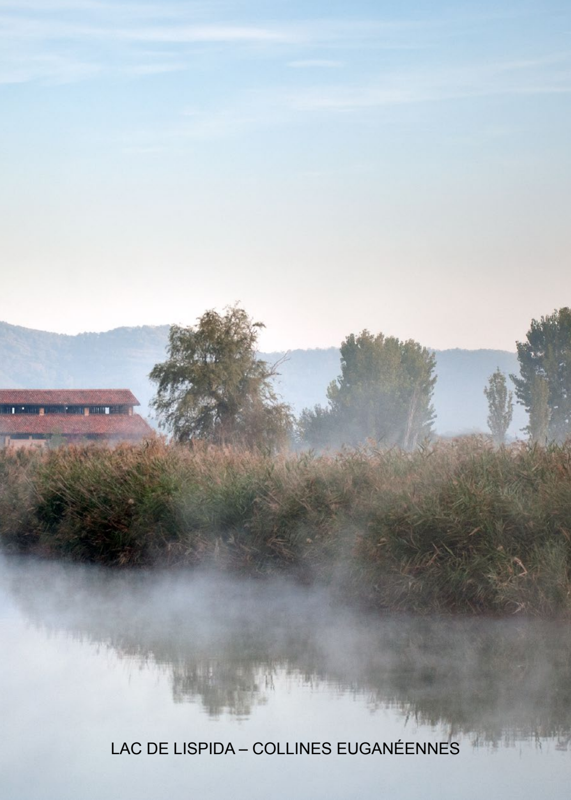
LAC DE LISPIDA – COLLINES EUGANÉENNES